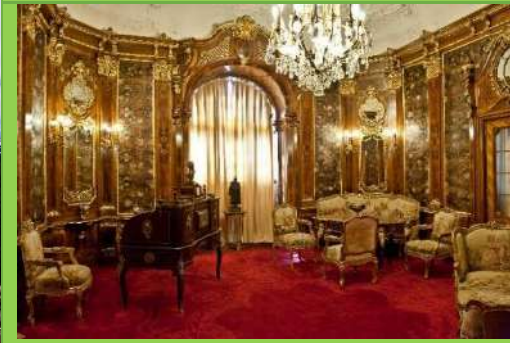
Castelul Peles, Camera baroca